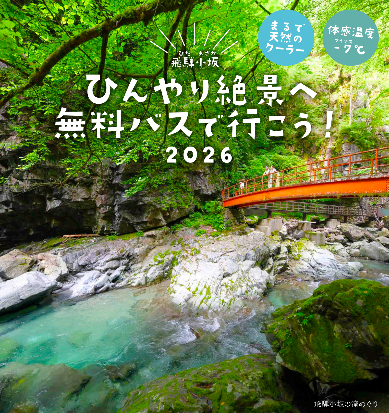
飛騨小坂の滝めぐり

運行期間 7月18日(土)～8月30日(日)のすべての土日・祝日 & お盆期間…8月11日(火・祝)～14日(金)