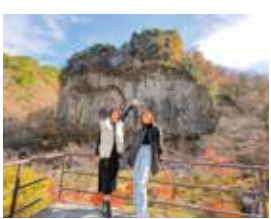
Gandatekyou en otoño